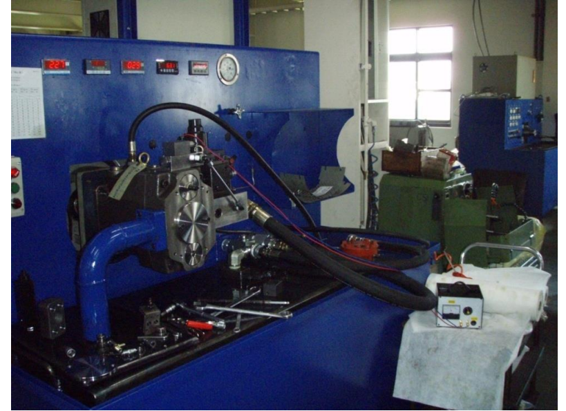
YÜKSEK BASINÇ TEST EKİPMANI