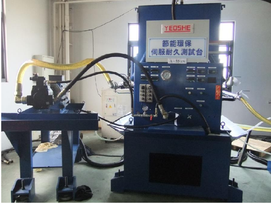
ÜRÜN TEST MERKEZİ